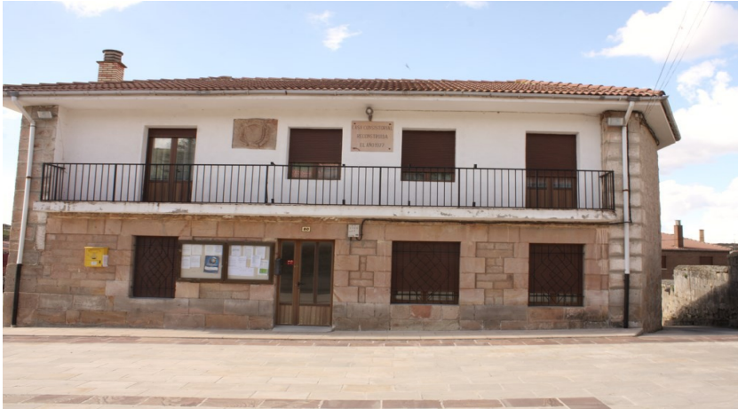
PLAZA AYUNTAMIENTO CASTRILLO DE LA REINA donde se efectuara la salida(BURGOS)

Y la llegada es en Zalla(Bizkaia) el 29 de Septiembre del 2018.